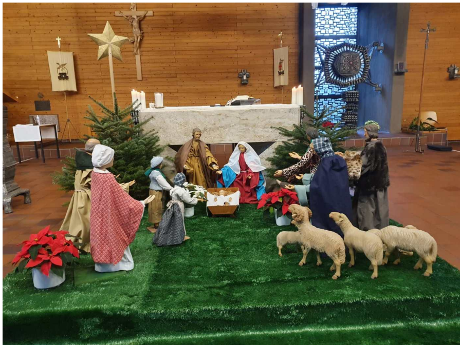
Die Krippe in der Katholischen Kirche in Reichelsheim.

In dieser Gegend lagerten Hirten auf freiem Feld und hielten Nachtwache bei ihrer Herde. Da trat ein Engel des Herrn zu ihnen und die Herrlichkeit des Herrn umstrahlte sie und sie fürchteten sich sehr. Der Engel sagte zu ihnen: Fürchtet euch nicht, denn siehe, ich verkünde euch eine große Freude, die dem ganzen Volk zuteilwerden soll: Heute ist euch in der Stadt Davids der Retter geboren; er ist der Christus, der Herr. Und das soll euch als Zeichen dienen: Ihr werdet ein Kind finden, das, in Windeln gewickelt, in einer Krippe liegt.